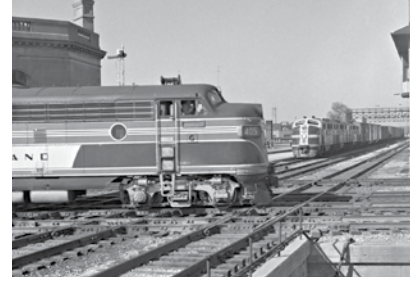
14 de octubre de 1951: un tren de mercancías de Santa Fe espera a un tren de Rock Island para cruzar la intersección de las líneas ferroviarias en el centro de Joliet.

El Museo del Ferrocarril de Joliet se encuentra en 90 E. Jefferson St. dentro de la estación de tren Gateway Center de la ciudad. El Museo del Ferrocarril cumple con los requisitos de acceso de la Ley de Americanos con Discapacidades (ADA, por sus siglas en inglés). Se puede estacionar con parquímetro en los estacionamientos públicos que rodean la estación de tren, así como en la calle. El Museo del Ferrocarril de Joliet es propiedad de la ciudad de Joliet y está administrado por el Museo Histórico del Área de Joliet. Para informarse sobre el horario actual de funcionamiento, llame al Museo Histórico del Área de Joliet al (815) 723-5201 o visite su sitio web: www.jolietmuseum.org/ .