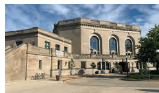
Union Station, Beaux-Arts style, 1912